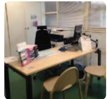
Clinique Grand Large